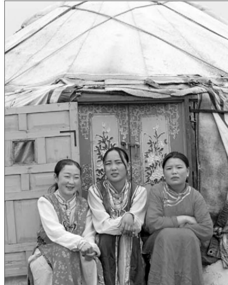
▲ Mujeres frente a su carpa redondeada

Esta comunidad del desierto también se traslada para encontrar alimento. Las personas viven en carpas y crían caballos.