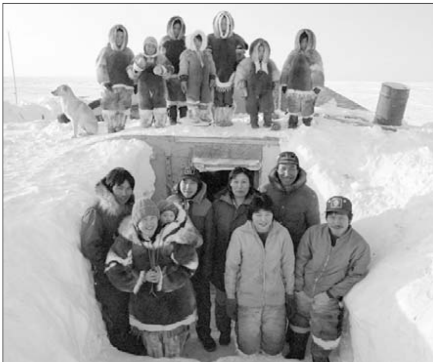
▲ Muchas familias juntas

Algunas salen a cazar animales. Otras familias permanecen cerca del mar para pescar. Durante el verano, hay más comida en un mismo lugar. Todas las familias viven juntas otra vez.