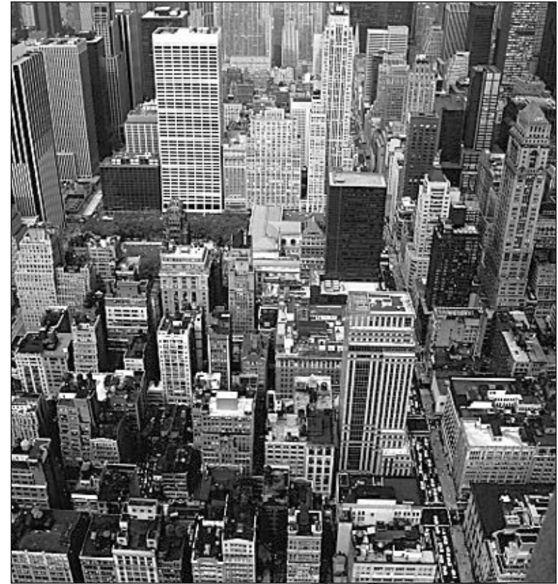
▲ New York City