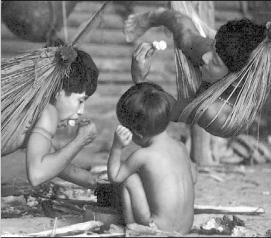
▲ Una familia en sus hamacas alrededor de una fogata

Cada familia tiene una fogata para cocinar sus alimentos. También tienen lugares para sentarse o descansar. Los niños juegan en el centro del anillo.