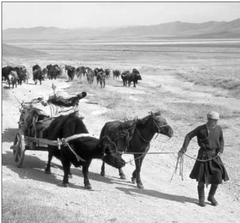
▲ Personas del desierto trasladándose

Los caballos comen grama. No hay mucha grama en el desierto. La comunidad se traslada cuando los caballos necesitan más grama. Las familias pueden mover sus carpas con facilidad.