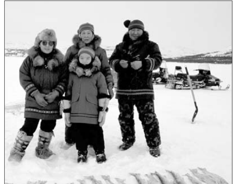
▲ Una familia pescando