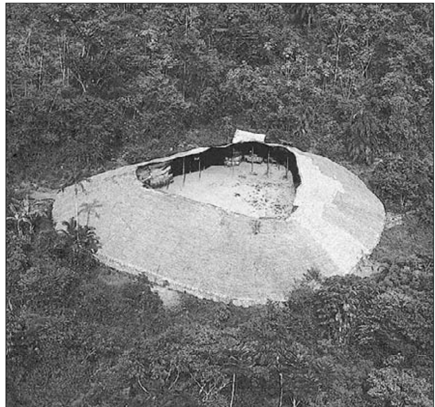
▲ Una aldea circular de los Yanomami