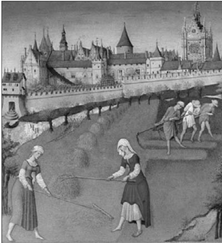
▲ Una pintura de personas cultivando cerca de un castillo

Otras familias vivían en casas en la aldea. Algunas familias cultivaban alimentos. Otras familias hacían cosas como por ejemplo herramientas.