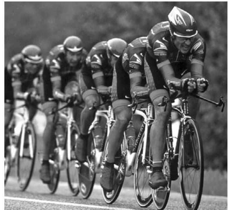
Lance compite con su equipo.

Montar en bicicleta en subida por montañas empinadas es la parte más difícil de la carrera. Todo el entrenamiento de Lance da su fruto en las montañas. Es uno de los mejores ciclistas del mundo cuando se trata de montar en bicicleta por las montañas.