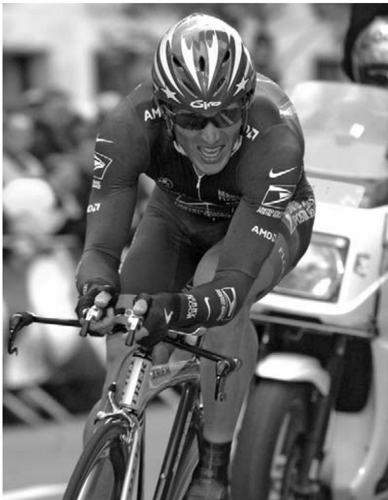
Lance compete in su sexto Tour de Francia.

El haber ganado el Tour de Francia una vez no era suficiente para Lance. Ganó la carrera el siguiente año, y continuó ganando año tras año.