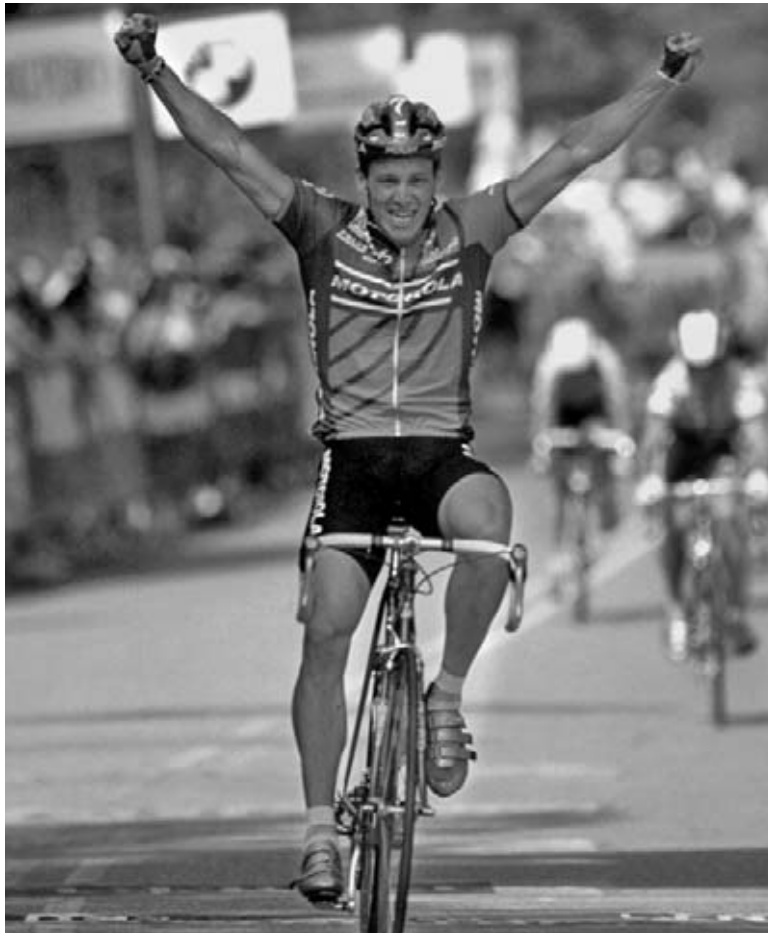
Lance gana parte de la carrera de bicicleta del Tour du Pont en 1993.

Al principio, Lance perdió la mayoría de las carreras. Pero trabajó duro para mejorar cada vez más. Comenzó a ganar carreras y estaba en camino a convertirse en un campeón ciclista .