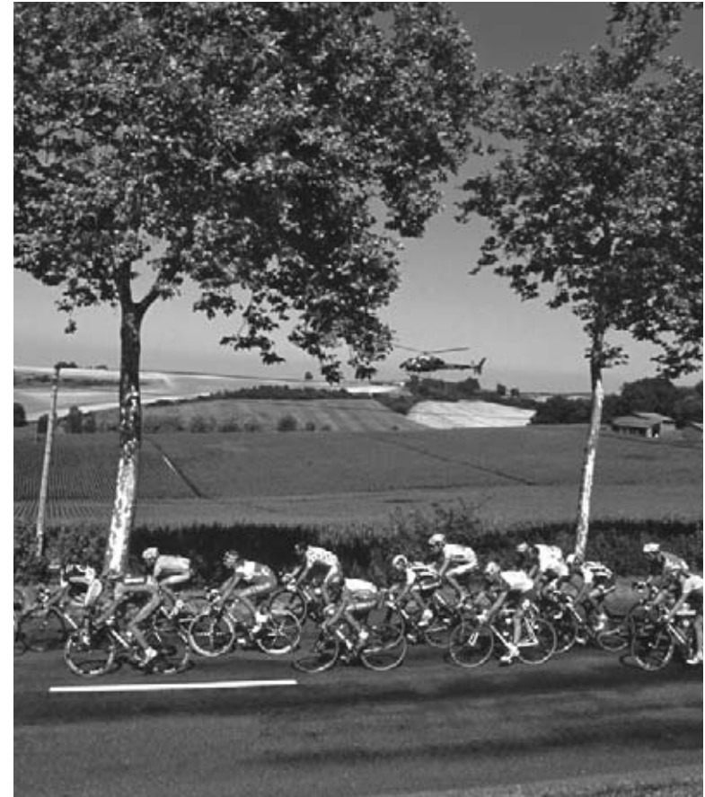
Corredores del Tour de Francia recorren la campiña francesa.

El Tour de Francia es una carrera muy difícil que dura tres semanas.