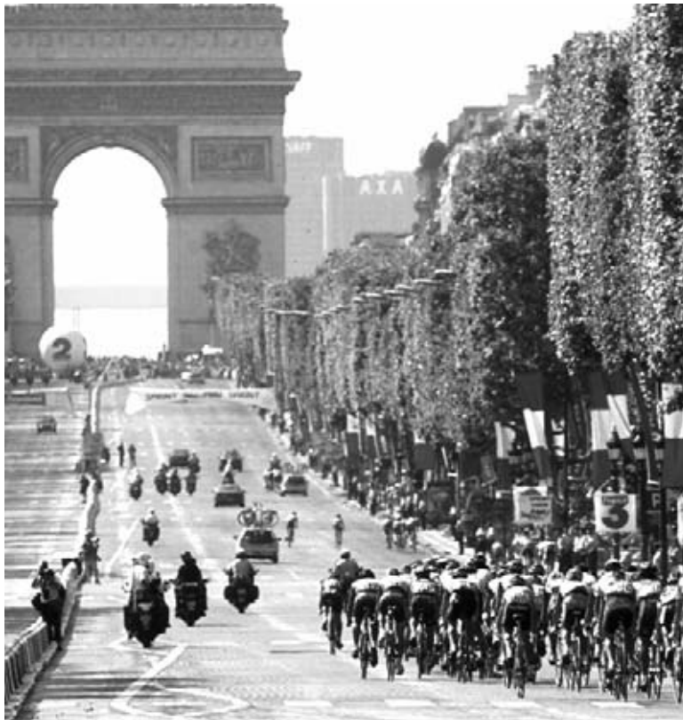
El Tour de Francia termina en París.