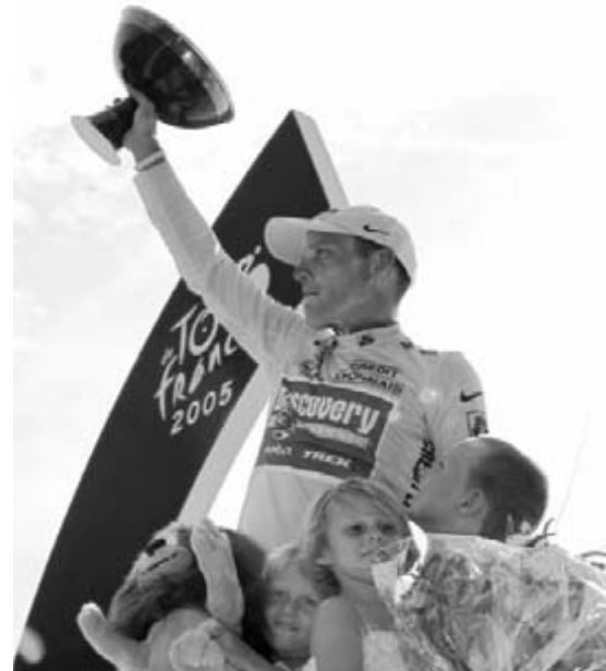
Lance Armstrong celebra su séptimo Tour de France con sus hijos Luke, Grace e Isabelle.