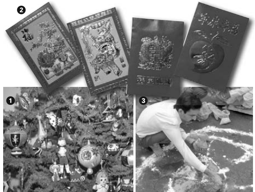
❶ Adornos decoran un árbol durante la Navidad ❷ Envoltorios para regalos que se usan durante el Año Nuevo Chino ❸ Durante Holi pintan el piso con colores brillantes

Las personas de todo el mundo celebran festividades que están llenas de tradiciones . Las tradiciones son la manera especial en que las personas hacen algo. Las personas celebran las festividades preparando comida, haciendo juegos, cantando canciones y contando historias.