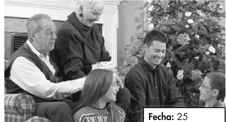
Las personas comparten tiempo juntos durante el día de Navidad.