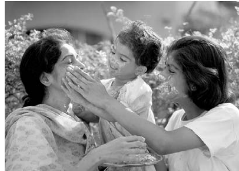
Los miembros de una familia se decoran entre ellos durante Holi.