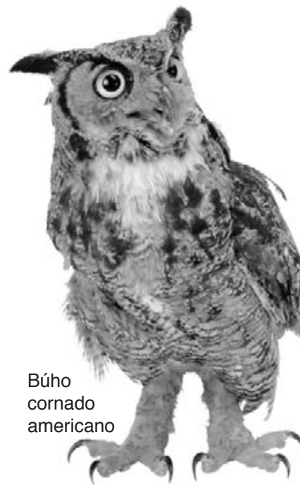
Búho cornado americano

Una de las más pequeñas lechuzas es el mochuelo chico norteamericano. Vive en el oeste de América del Norte. Mide solamente unos 16 centímetros (6 pulgadas) de alto. Pero, ¡es feroz! El mochuelo chico a menudo puede ahuyentar a animales más grandes que sí mismo. Los mochuelos chicos viven en huecos en los árboles. Les gusta comer pájaros pequeños, lagartos e insectos.