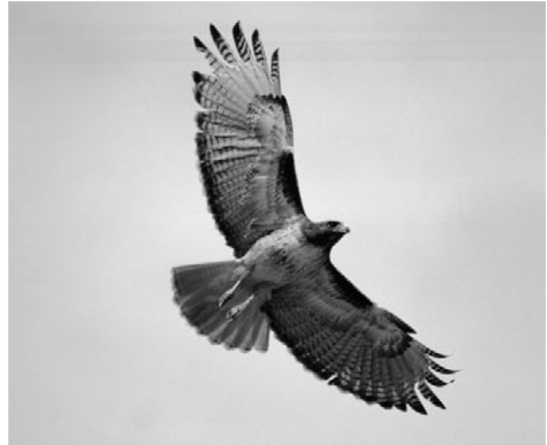
Gavilán de cola roja