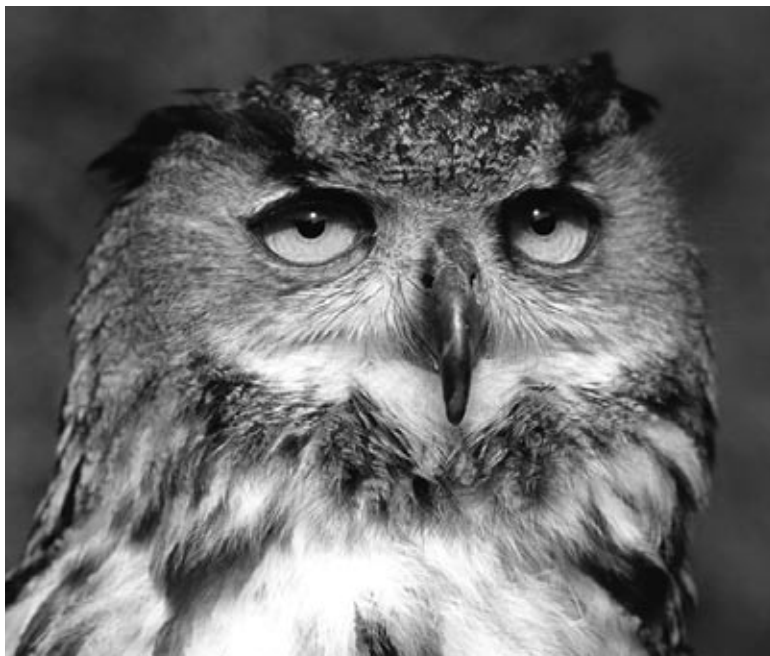
Búho real europeo