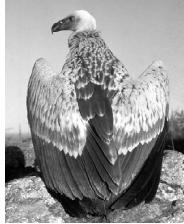
Buitre de El Cabo

Los halcones son voladores veloces. El halcón peregrino vive en panoramas que abarcan desde la tundra del ártico hasta la selva tropical. Es una de las aves rapaces más veloces en el aire. Cuando vuela en picada, puede alcanzar una velocidad de 322 kilómetros (200 millas) por hora. El halcón peregrino usualmente come presas que atrapa en medio vuelo.