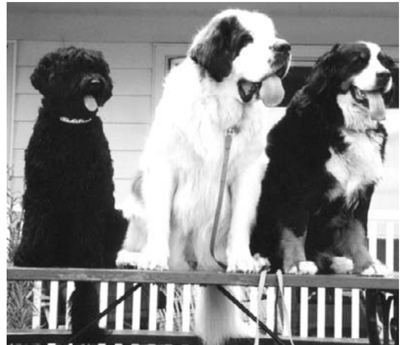
Perro de aguas portugués, perro San Bernardo y perro bernés de la montaña

¿Has notado alguna vez cuántas clases diferentes de perros hay? Hay perros grandes, perros chicos, perros largos, perros cortos, perros peludos y hasta perros sin pelo. Hay perros con orejas grandes, orejas chicas, narices grandes, narices chicas, patas largas, patas cortas, colas largas y sin ninguna cola.