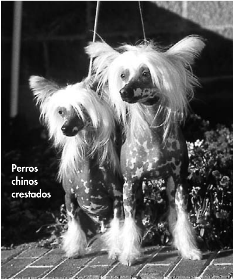
Perros chinos crestados

El perro chino crestado es pelón exceptuando unos mechones de pelo en su cabeza y patas. Tiene piel gris oscura con manchas rosadas. Necesita crema de filtro solar en el verano. En el invierno, necesita un abrigo para mantenerse caliente.