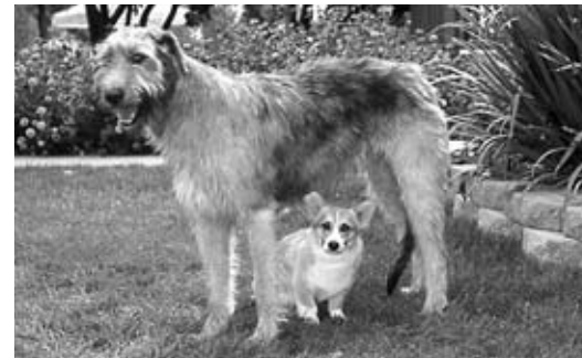
Lobero irlandés con un corgi galés

El trabajo de los perros de rastreo es perseguir a la presa por el suelo. Hay dos clases de perros de rastreo. Los de vista usan sus ojos para perseguir la presa. Los de olfato usan su nariz para seguir la pista de la presa por su olor. Algunos perros de rastreo ladran para decirle al cazador que tienen a la presa acorralada, otros pueden matar la presa ellos mismos.