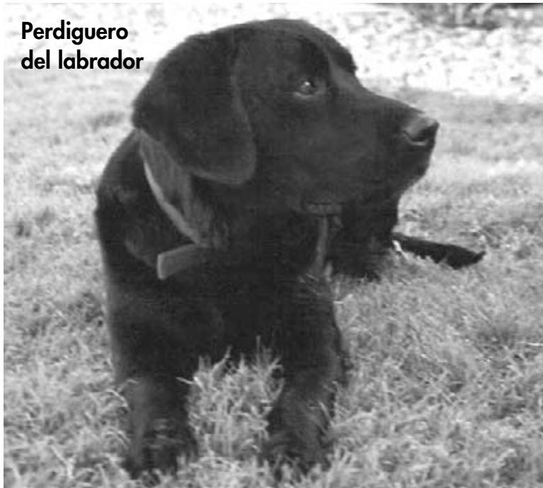
Perdiguero del labrador

El perdiguero del labrador, o lab, es un perro de muestra popular que también es un buen perro de familia. Al principio fue criado para cobrar, o sea traer de vuelta, los pájaros que se habían cazado si ellos caían en una laguna o lago. Los perdigueros del labrador tienen dedos palmeados que les ayudan a nadar bien. Su pelaje impermeable los mantiene calientes en agua fría. Tienen fuertes mandíbulas para llevar pájaros pesados.