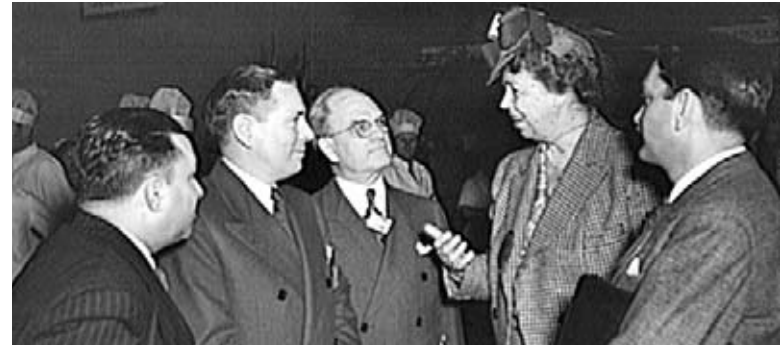
Eleanor Roosevelt habla sobre política.

Cuando George Washington era presidente, la gente no sabía cómo llamar a su esposa, Martha. Un día una multitud saludó a Martha Washington con gritos de, "¡Viva Lady (dama) Washington!". Al poco tiempo, el término primera dama comenzó a usarse. Se agregó al diccionario en 1934.