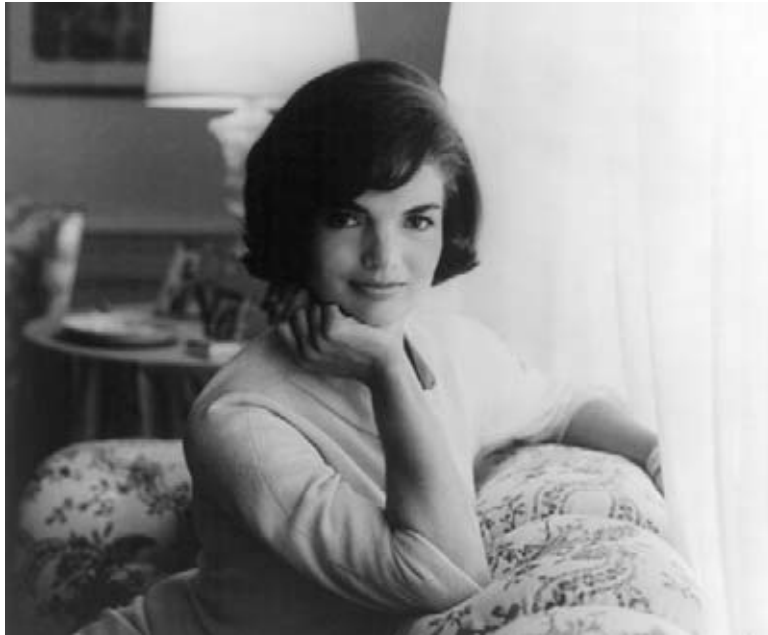
Jackie Kennedy en su primer retrato como primera dama.

Cuando Jackie Kennedy fue primera dama, invitó a todo los Estados Unidos a conocer la Casa Blanca. Un equipo de cámaras de televisión de CBS acompañó a Jackie Kennedy en un tur personal por la Casa Blanca en 1961.