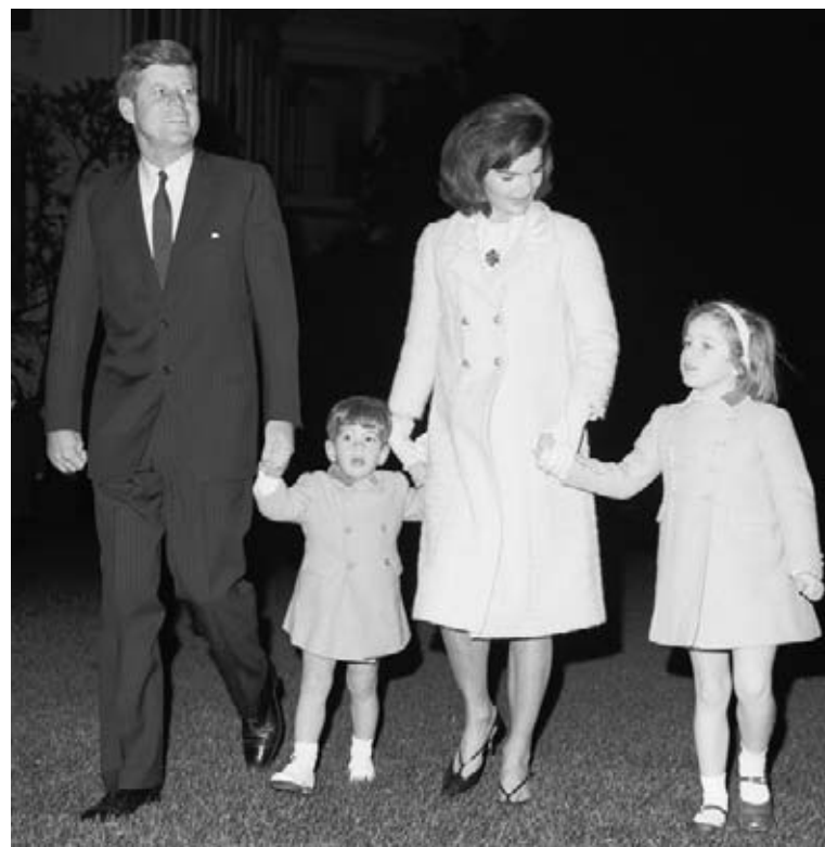
La familia Kennedy en el jardín de la Casa Blanca

Jackie conoció a un joven llamado John “Jack” Kennedy en 1952. Él le dijo que un día sería presidente de los Estados Unidos. Un año más tarde, era senador de los EE.UU. Se casaron en 1953. Fue elegido presidente en 1960. La familia Kennedy se mudó a la Casa Blanca con sus dos hijos, Caroline que tenía tres años de edad y John Jr. que era apenas un bebé.