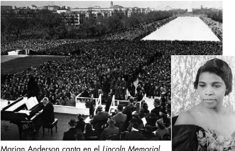
Marian Anderson canta en el Lincoln Memorial .

En 1939, la famosa cantante Marian Anderson iba a cantar en el Constitution Hall en Washington, D.C. Sin embargo, el grupo llamado Hijas de la Revolución Americana, que eran las dueñas del edificio, le prohibieron cantar allí. ¿La causa? Marian Anderson era afroamericana. Eleanor Roosevelt presentó su renuncia al grupo en protesta por su muestra de discriminación . Luego invitó a Anderson a cantar en el Lincoln Memorial, donde 75,000 personas vieron el concierto. Otros millones escucharon la hermosa voz de Anderson en la radio.