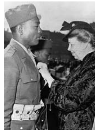
Eleanor Roosevelt le coloca una medalla a un soldado.

en participar activamente en política. Gracias a su actuación en los asuntos mundiales, se la conoció como la primera dama del mundo. En 1945, su marido muere de polio , una enfermedad que había sufrido durante su presidencia.