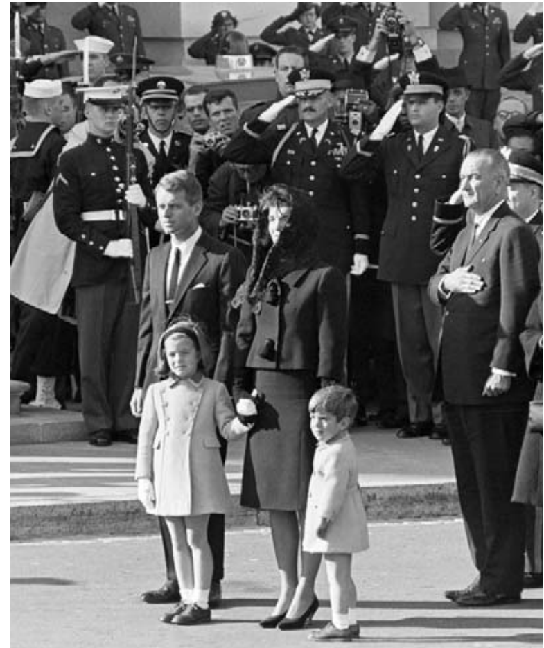
Jackie Kennedy y sus hijos participan del funeral de su marido.

En 1963, el presidente Kennedy fue asesinado. El coraje de Jackie durante la tragedia se ganó la admiración del mundo. Desde 1978 hasta que murió de cáncer en 1994, la ex primera dama vivió y trabajó en la ciudad de New York.