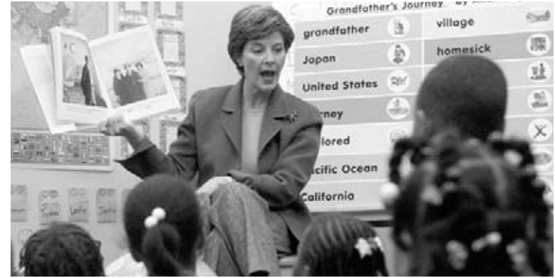
La primera dama Laura Bush en 2004