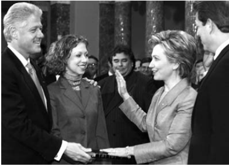
Hillary Clinton realiza el juramento como senadora de los EE.UU. por el estado de New York.

Hillary Clinton había estado interesada en la política durante su juventud. Mucha gente dice que su período como primera dama fue más influyente que el de otras primeras damas.