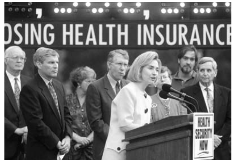
Hillary Rodham Clinton apoya la reforma de la asistencia sanitaria.

El presidente Clinton le pidió a Hillary Clinton que encabezara el grupo de trabajo de la reforma de la Asistencia Sanitaria Nacional. Fue la primera primera dama en tener un cargo oficial en el gobierno durante la presidencia de su esposo.