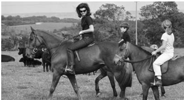
Jackie Kennedy monta a caballo con sus hijos.