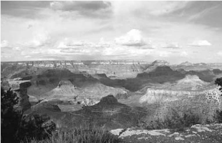
El Gran Cañón es uno de los parques nacionales más famosos.

Muchos parques protegen culturas y su historia. En los parques nacionales del mundo puedes ver artefactos , u objetos, que pasadas civilizaciones dejaron. Algunos preservan formas de vida antiguas que todavía se practican.