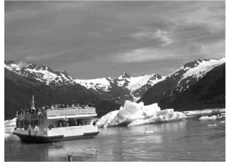
Los visitantes recorren el área de conservación marina en Québec.