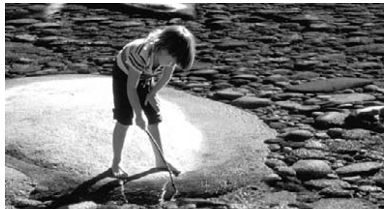
Encuentra un lugar especial para ti.