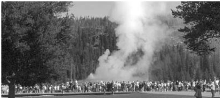
Los géiseres de Yellowstone atraen a millones de visitantes todos los años.

Por todas las razones mencionadas, los parques nacionales pueden llegar a dañarse. A la vez, esto refuerza la importancia de los mismos. La mayoría de las áreas del mundo fueron ya afectadas por la industria y el desarrollo humano. Los parques nacionales son algunas de las últimas áreas no afectadas por el desarrollo humano. Si futuras generaciones quieren encontrar su propio lugar especial natural, entonces las personas del mundo deben trabajar para preservar estos tesoros nacionales.