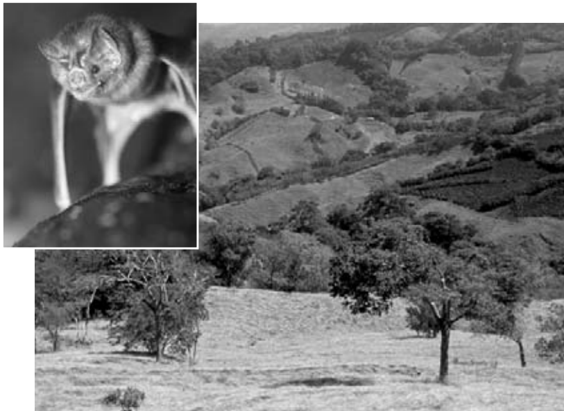
Muchos murciélagos anidan en las cuevas de Santa Rosa.

La parte interior del parque tiene sabanas y el bosque tropical seco más grande de América Central. Este hábitat sustenta monos aulladores, cerdos salvajes y más de 50 especies de murciélagos que anidan en las muchas cuevas del parque. Muchos científicos vienen a este rico paisaje natural para estudiar cómo las plantas y los animales del bosque y el océano interactúan. Dos lugares históricos preservan la memoria de dos importantes batallas durante la lucha por la independencia de Costa Rica. Los visitantes pueden visitar estos lugares y disfrutar de una caminata, hacer campamento y hacer surf.