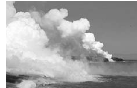
El vapor de la lava calentando el océano

Cuando cae en el océano, suelta penachos de vapor. ¡Esta es la formación de la isla vista de cerca! Las áreas silvestres también ofrecen lugares para