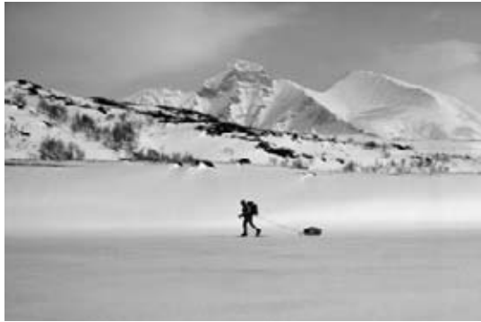
Por encima del círculo polar ártico

Parque nacional Sarek, Suecia; Suecia fue el primer país de Europa en crear parques nacionales. Éste, muy al norte del círculo polar ártico, es el área salvaje más grande de Europa occidental. Está repleto de majestuosas montañas y glaciares. Es también el hogar de los sámi, o lapp, quienes pastorean renos.