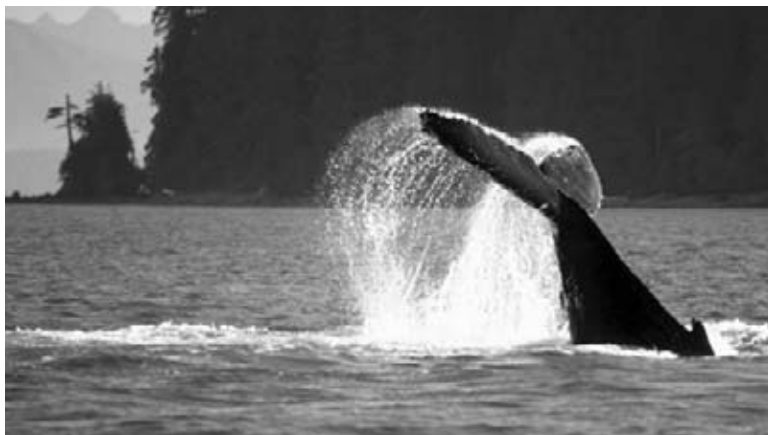
Muchas ballenas vienen al fiordo de Saguenay durante los meses cálidos.

Entonces, ¿cómo visitas un parque bajo el agua? Muchas personas eligen ver de cerca a las ballenas y otros animales desde un barco. El parque ofrece avistamientos de ballenas y viajes en kayaks, pequeños botes tipo canoas. Los visitantes también pueden bucear, hacer caminatas y pescar en el hielo.