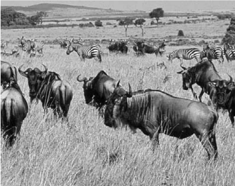
Las llanuras del Serengeti ofrecen una abundante vida salvaje.

El Serengeti es una de las sabanas , o prado seco, más antigua y grande de la Tierra. Es el último refugio de muchos de los más famosos animales africanos. Todos los años, cientos de miles de ñúes azules y cebras migran , o se mueven a través de las llanuras, siguiendo las estaciones de lluvia. Maravillosos predadores, incluyendo a los leones, cocodrilos, guepardos y hienas los persiguen. Muchos de los animales del Serengeti, incluyendo los rinocerontes, guepardos y algunos antílopes, están en grave peligro de extinción. Sin el parque que proteja su hábitat , estas criaturas probablemente se volverían extintas .