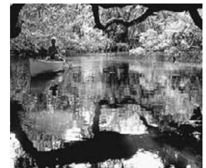
Región pantanosa de Florida

Parque nacional Everglades, Florida, EE.UU. Los caimanes se deslizan a través de los pantanos del área subtropical silvestre más grande de América del Norte. Pantanos frágiles, prados y costas cenagosas están preservados aquí. Mamíferos poco comunes como la pantera de la Florida y el manatí prosperan aquí.