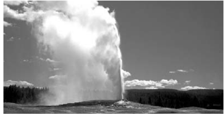
Yellowstone tiene muchos géiseres.

Los parques nacionales también ofrecen intactos lugares silvestres donde la gente puede escaparse de todo. Los visitantes pueden ver vida silvestre poco común, formaciones de tierra únicas, artefactos antiguos y pedazos de su propia historia. También pueden rodearse de toda la belleza de la naturaleza haciendo caminatas, como mochileros, acampando y otras actividades.