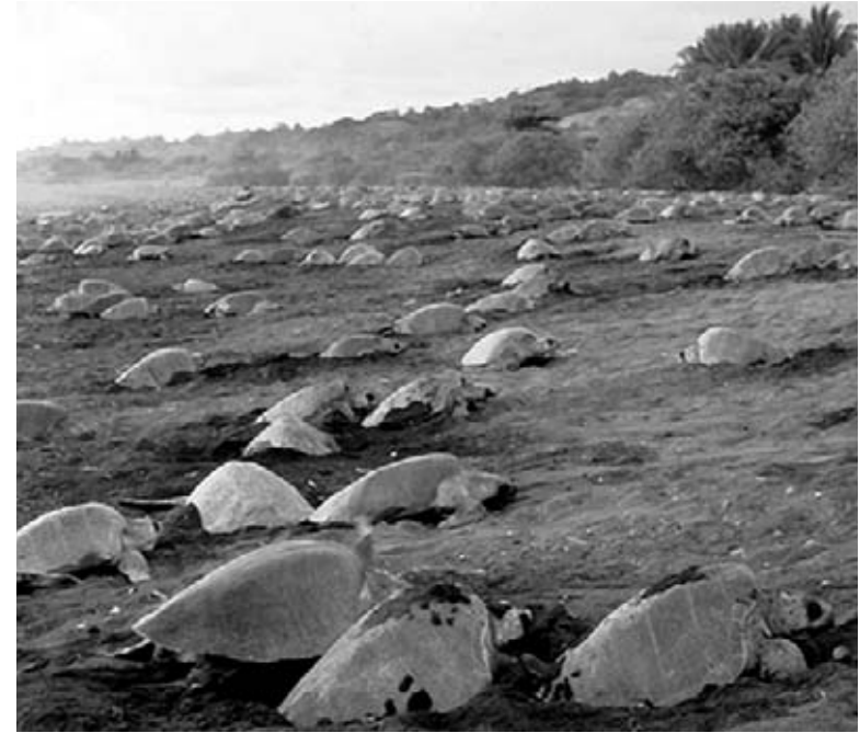
Tortugas marinas desovan en una playa de Costa Rica.

El Serengeti es una de las sabanas , o prado seco, más antigua y grande de la Tierra. Es el último refugio de muchos de los más famosos animales africanos. Todos los años, cientos de miles de ñúes azules y cebras migran , o se mueven a través de las llanuras, siguiendo las estaciones de lluvia. Maravillosos predadores, incluyendo a los leones, cocodrilos, guepardos y hienas los persiguen. Muchos de los animales del Serengeti, incluyendo los rinocerontes, guepardos y algunos antílopes, están en grave peligro de extinción. Sin el parque que proteja su hábitat , estas criaturas probablemente se volverían extintas .