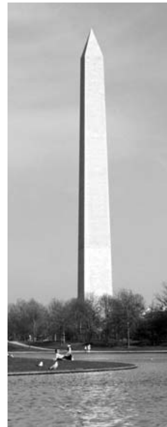
Monumento de Washington

Washington, D.C., EE.UU. Es fácil imaginar parques nacionales como espacios de territorio silvestre. No es fácil imaginar un parque dentro de una gran ciudad. Pero, eso es lo que el parque Rock Creek es. Es un área pequeña de 1,700 acres de patrimonio cultural y natural preservado, justo en el centro de la capital de los EE.UU.